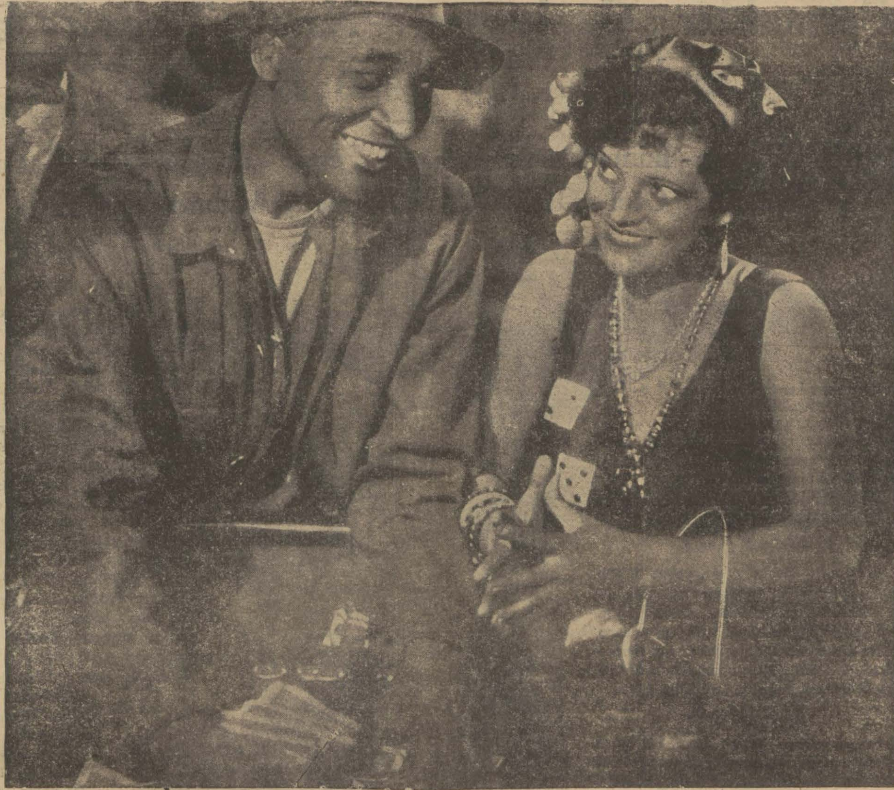
Haleluya filmini yaratan iki büyük artist: Nina Mae Mac Kinney ve Daniyel Haynes

Sesli film çıkışları mevzular ihmal ediliyordu. İlk defa olarak mevzuuna ehemmiyet verilerk yapılan film Haleluyadır.