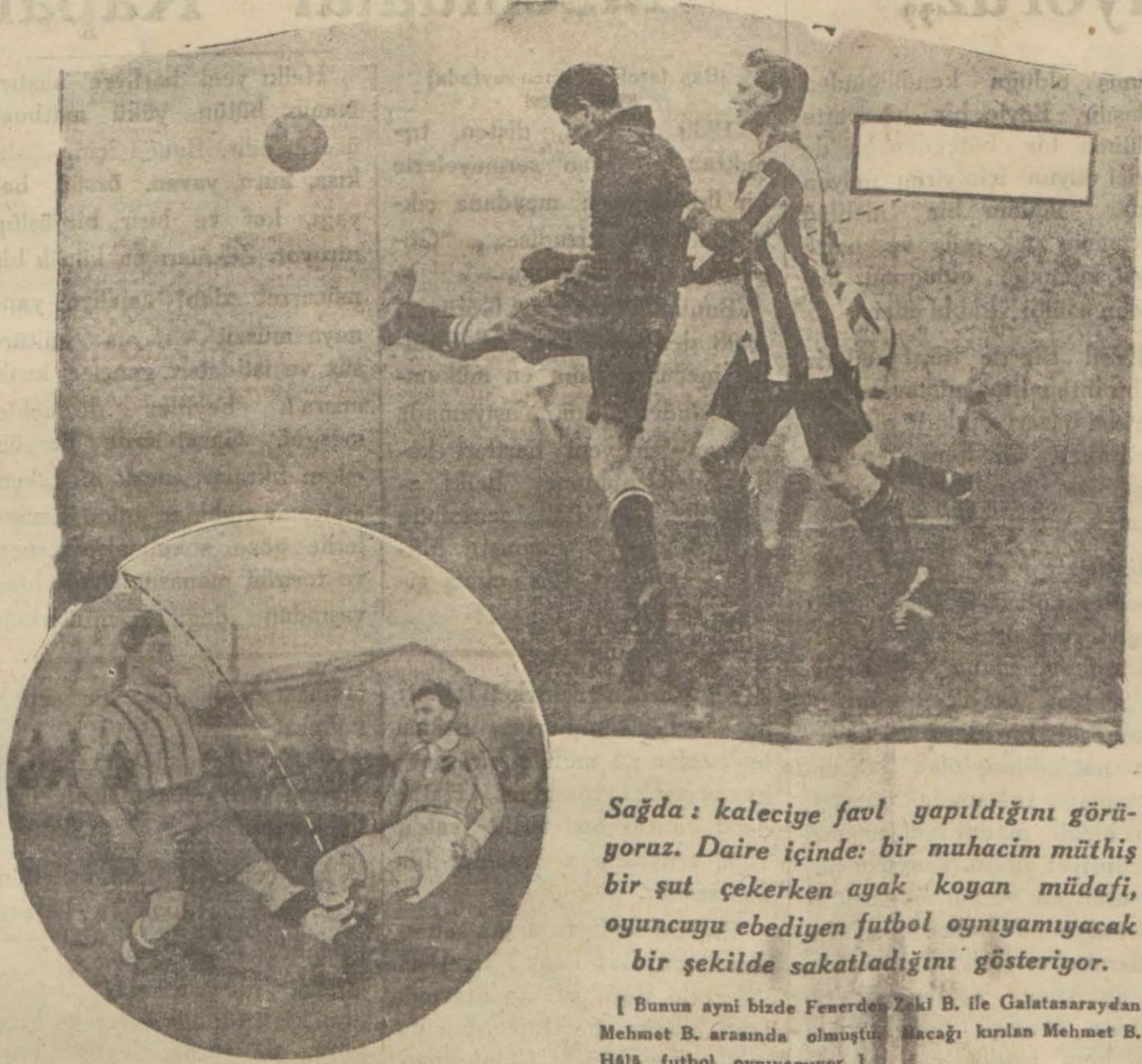
Sağda: kaleciye faul yapıldığını görüyoruz. Daire içinde: bir muhacim müthiş bir şut çekerken ayak koyan müdafî, oyuncuyu ebediyen futbol oynyamıyacak bir şekilde sakatladığını gösteriyor.