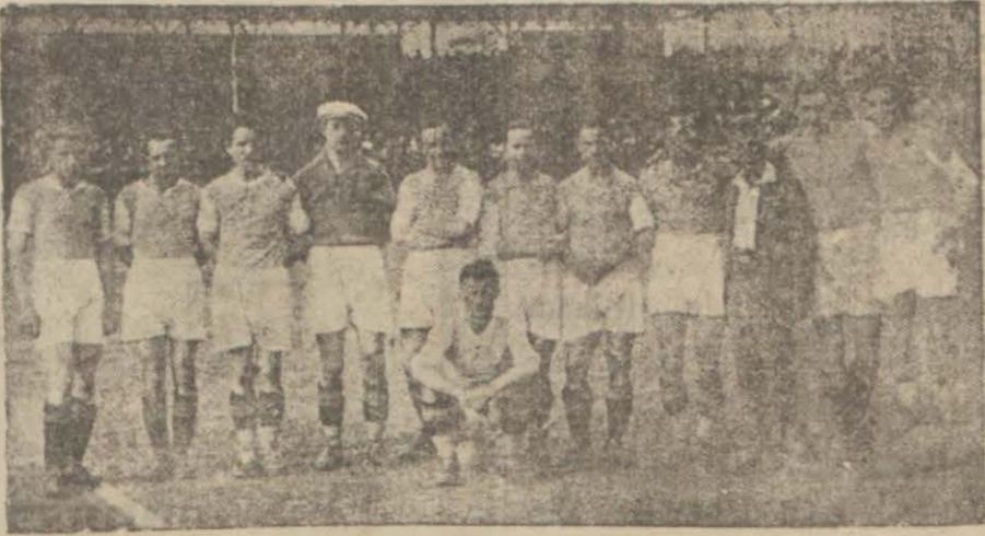
Fransada 2-5 galip gelen Upeşt takımı

Meşhur Arsenal takımı ve Sheffield Wednesday müsavi puvanda bulunuyorlar.